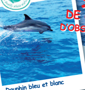
Dauphin bleu et blanc